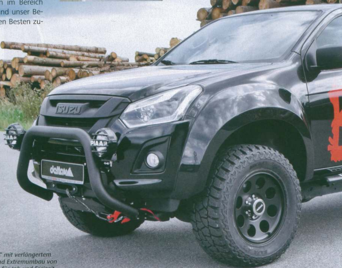
Big Toy für Big Boys: „The Beast“ mit verlängertem Radstand, SpaceCab-Pritsche und Extremumbau von Delta 4x4 ist ein Universal talent für Job und Freizeit

sammenzuarbeiten.“ Das bayrische Unternehmen, das vor 45 Jahren die allererste Tischer-Wohnkabine auf dem legendären Bulli T2 präsentierte, hat ein kompaktes, vollwertiges Familien-Wohnmobil entwickelt, das den Vorteil der Absatzkabine behält. Durch die Radstandverlängerung und die damit verbundenen Auflastungsmöglichkeiten des D-Max konnte die 260er Wohnkabine sehr großzügig ausfallen. Der Motor blieb unangetastet. „Der hocheffiziente 1,9-l-Turbo-Diesel mit 163 PS und Euro 6 ist stark, sparsam, robust und hat kürzlich einen Umweltpreis gewonnen. Wir sehen da überhaupt keinen Grund, einzugreifen“, meint Thomas Brinkmann, „geliebt sind auch Wendigkeit, Agilität und Anhängelast.“ Beim zulässigen Zuggesamtgewicht schafft der Gethöffer Big Max sogar eine Erhöhung auf 7,0t, die Radstandverlängerung wurde von der Technischen Universität Osnabrück in ausführlichen