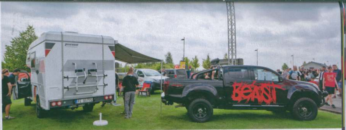
Bei GRIP CARS & COFFEE war die kompakte Absetzkabine ein Hingucker. Und nicht nur sie: Der geländegängige D-Max „The Beast“ im Bad-Boy-Look zog alle Blicke auf sich